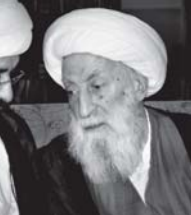
مشهد شهنامه ۱۳۹۲

لطفآیه در باره اول پروکات این حرکت برای خود ایشان و دیگران توضیحاتی فرمایید. آقایان می فرماید: آقا جان، ما اجازه دهید به آنجا برویم. از رحلت ایشان اشاره کنیم. اول در تشیع جنازه ایشان خصلت طلب علم حضور داشتند که کم سابقه است؛ اینها همه اش به سبب این بود که برای حضرت زهرا علیها السلام تلاش کردند. شب و روز تلاش می کرد که این نام زنده بماند. گرچه اعتقادی ندارم که خواب نقل شود، ولی خداوند هم خواب نقل می کند. بعد از رحلت ایشان در عالم روایا از ایشان پرسیدند که بعد از اینکه از دنیا رفتند یا شما چه کردند؟ فرمود: