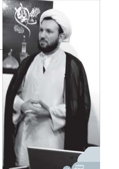
پایگاه آذینکشی آموزشی ترویجی

دارند لذا در همین راستا این عرفان‌ها قیلم‌ها و برنامه‌های خود را تولید کرده، آنها را در سطح گسترده‌تری می‌نمایند.