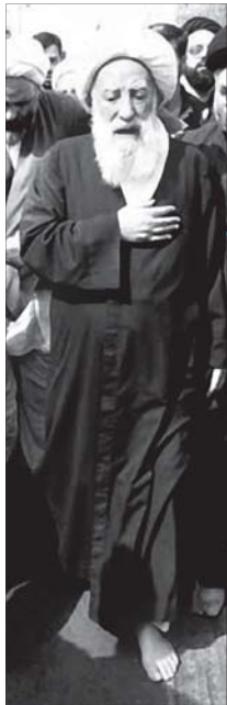
پادشاه آسودگی توحیدی