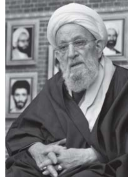
یادنامه آیت‌الله مرتضی

آزاد شود و یکی از پسرانم شهید شود. سه روز بعد دخترم آزاد شد و پسر من شهید شد. کتاب خاطرات دختر این مادر شهید به نام «معمومه این» چاپ شده است که علاقه‌مندان می‌توانند مطالعه کنند.