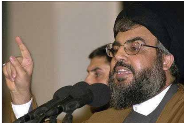
سید حسن نصرالله:

مسجد یادواره در مسکو، به یاد مسلمانان کشته شده در جنگ جهانی دوم، در این شهر بنا شده است. به یاد عده ای از مسلمانان روسیه که در جنگ جهانی دوم شرکت جسته و در راه دفاع از وطن خویش کشته شده بودند، مسجد یادواره در شهر مسکو بنا شد. نمای ظاهری مسجد که طراح آن الیاس تاجیوف، یکی از معماران مشهور مسکو است، بیان کننده چهره مدارس معماری مسلمانان شرق از جمله تاتاری، ازبکی و قفقازی است. در حال حاضر در کنار مسجد یادواره که زیبایی خاصی را به چهره شهر مسکو بخشیده است، مدرسه علمیه و انجمنی داتر است.