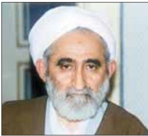
روحانیون و مبلغان دینی، اظهار داشت: شما و مساجد هستید که می‌توانید در استحکام ایمان و عقاید مردم و وفادار نگه داشتن آنها به نظام جمهوری

اسلامی، نقش مؤثری ایفا کنید. رئیس اداره تبلیغات اسلامی کاشان نیز در این آیین از روحانیون و امامان جماعات کاشان و بیدگل خواست تا نمازگزاران و اهالی مساجد را برای نظافت و آماده سازی مسجدها در آستانه ماه مبارک رمضان فراخوانند. حجت الاسلام والمسلمین سید عبدالصاحب حسینی، همچنین از ساماندهی خواهران مبلغ و روحانی خبرداد و گفت: بیش از ۲۰۰ خواهر مبلغ در شهرستان وجود دارد. همایش روحانیون و امامان جماعات مساجد کاشان و آران و بیدگل در آستانه ماه مبارک رمضان، با حضور آیت الله نمازی نماینده ولی فقیه و امام جمعه کاشان و جمع کثیری از روحانیون این دوشهرستان در کانون فرهنگی تربیتی الزهر(س) کاشان برگزار شد.