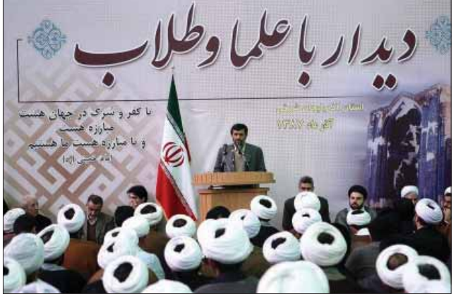
رئیس جمهور در دیدار با طلاب آذربایجان شرقی:

حضرت آیت الله حسین نوری همدانی از مراجع عظام تقلید گفت: دشمنان اسلام برای انحراف جامعه، گسترش افکار خرافی را در اولویت برنامه خود قرار داده است. وی در درس خارج فقه خود در مسجد اعظم قم افزود: در این شرایط پیروی از اصول ولایت فقیه بهترین راه برای مقابله با این توطئه دشمنان است. وی ادامه داد: پیروی از ولایت فقیه گسترش اسلام در جهان و خنثی سازی توطئه دینی و مذهبی را بهترین مکان برای نشر افکار و ارزشهای دینی دانست و افزود: هدف اصلی دشمنان از گسترش تبلیغات منفی خود در جامعه اسلامی دوری نمودن مردم از مرکز دینی است. آیت الله نوری همدانی همچنین گفت: اگر این مراکز دینی در جامعه نباشد، هیچ اثری از دین نخواهد بود. این مرجع تقلید افزود: مقابله با توطئه های دشمن از طریق فعالیت فرهنگی و دعوت از جهانیان برای گرایش به اسلام در این مقطع یک جهاد به حساب می آید، که از آن در اسلام به عنوان جهاد ابتدایی تعبیر می شود. وی همچنین در ادامه با اشاره به اهمیت مساله جهاد و مبارزه در راه خدا اظهار داشت: در اسلام در زمان حضور امام معصوم (ع) جهاد برای هر فرد مسلمانی واجب است. وی ادامه داد: بر طبق آیات و روایات اسلامی در زمان غیبت امام زمان (عج) نیز جهاد و مبارزه برای صیانت از ارزشهای گرانبهائی اسلام به آن رهبر جامعه اسلامی که به نیابت از امام معصوم (ع) زمام امور مسلمین را در دست دارد برای هر فرد مسلمانی واجب است. وی تصریح کرد: جهاد در اسلام تنها به جهاد دفاعی محدود نمی گردد، بلکه کسانی که به ترویج دین اسلام نیز می پردازند در واقع به جهاد مشغول هستند.