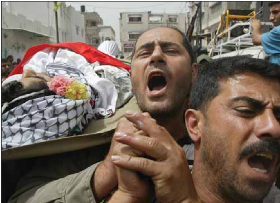
علامه فضل الله خواستار شد :