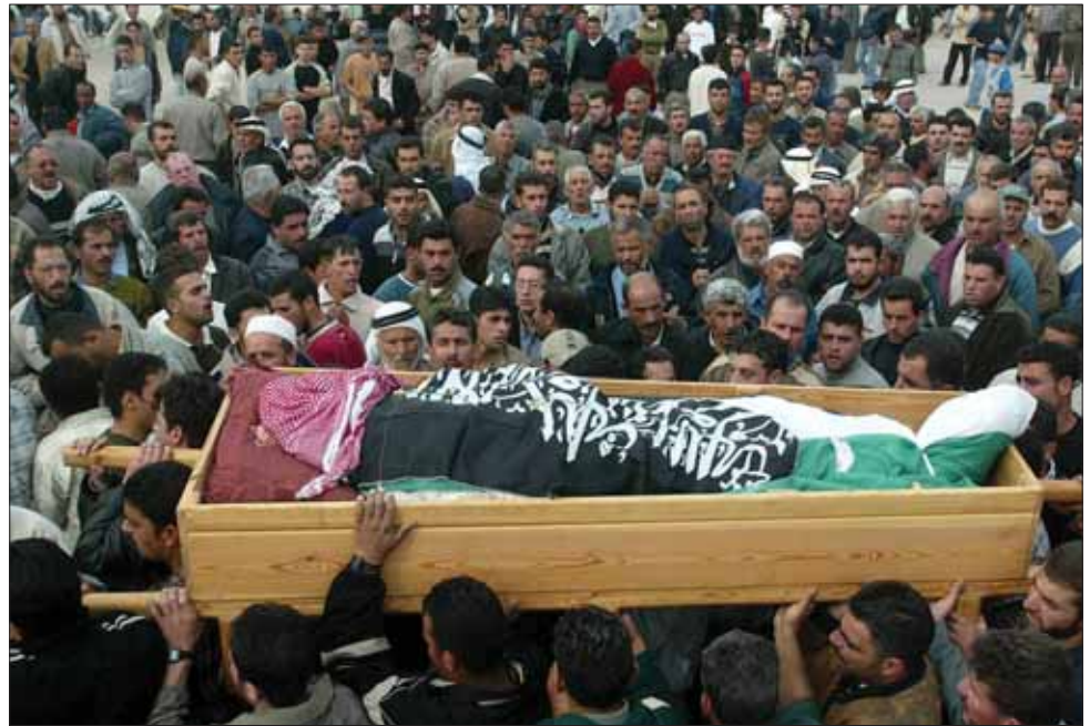
به رغم تداوم بمباران مساجد؛