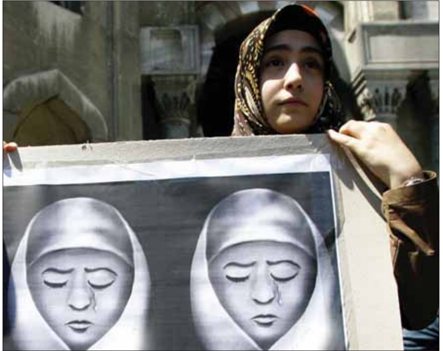
موازی کاری در حوزه حجاب

با تقسیم کار بر اساس رسالت دستگاه‌ها مرتفع می‌شود