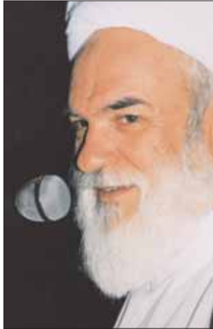
حجت الاسلام والمسلمین خاتمی: