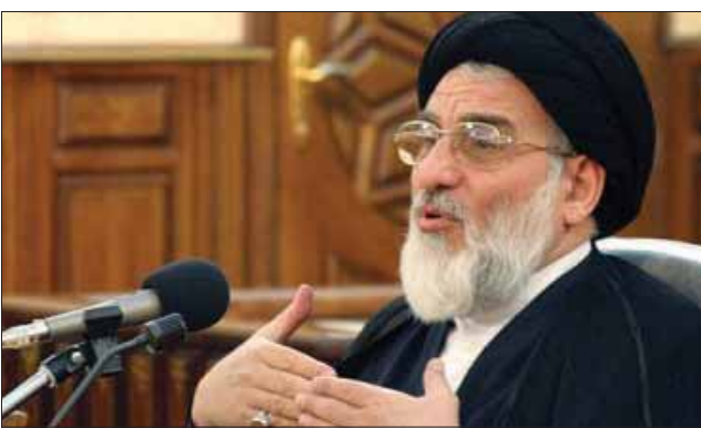
زمینه باید برای رفع شبهات بکشند. نماینده ولی فقیه و امام جمعه شهر کرد نیز گفت: استان

چهار محال و بختیاری از نظر پرداختن به مسایل دینی تلاش بسیار زیادی داشته است. آیت الله محمد رضا ناصری گفت: تلاش شده است برای ترویج مفاهیم دینی بین جوانان مدارس، تعداد معارف و حوزه های علمیه در استان را گسترش یابد. وی گفت: روحانیت استان در پیش از انقلاب اسلامی مورد ظلم خوانین دوره پهلوی قرار داشتند اما آنان دست از مبارزات خود برداشته و تلاش زیادی را در راستای ترویج دین به عمل آوردند. به گفته وی، وجود یکپارز و ۲۰۰ نفر روحانی دینی با تالیفات و پژوهش های گسترده و یکپارز و ۵۰۰ تربیت یافته مدارس معارف اسلامی، بخشی از تلاش های دینی صورت گرفته در این استان بوده است. این دیدار با معاونین قوه قضاییه، دادستان کل و جمعی از روحانیون و ائمه جمعه استان برگزار شد.