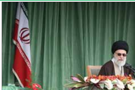
مقابل راد می کنید اما در این روند از جاده انصاف نباید خارج شوید.