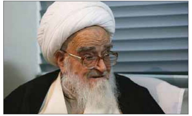
آیت الله سبحانی:

حضرت آیت الله، لطف الله صافی گلپایگانی، از مراجع عظام تقلید گفت: نامزدهای انتخابات ریاست جمهوری باید اخلاق انتخاباتی را رعایت کنند تا زمینه برای حضور پرشور مردم فراهم شود. وی افزود: لازم است که نامزدها برای حضور پرشور مردم در انتخابات رعایت اخلاق اسلامی را جدی بگیرند و تنها به ارایه برنامه های خود بپردازند. وی گفت: در تبلیغات باید به بحث معنویت و اخلاق توجه شود و برای اینکه مردم حضور پرشوری داشته باشند، می بایست تنها برنامه های خود را به صورت اخلاقی بیان کنند.