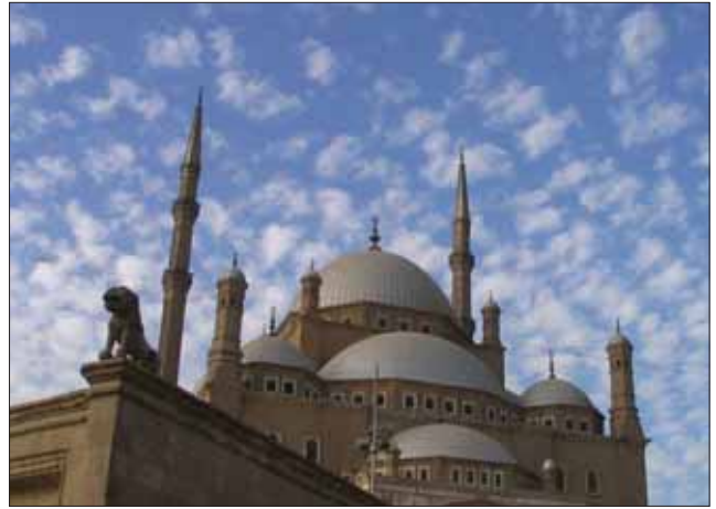
مردم بوسنی پس از سال‌ها اختناق دوران کمونیسم و متعاقب آن قتل عام توسط صرب‌ها و کرووات‌ها، امروز بار دیگر دین اسلام را دوباره کشف می‌کنند. روزنامه واکیت ترکیه در مقاله‌ای پیرامون

مردم بوسنی می‌نویسد بوسنیایی‌ها که در دوران کمونیسم از دین خود یعنی اسلام منع شده و در فاصله سال‌های ۱۹۹۰ تا ۱۹۹۵ توسط صرب‌ها و کرووات، مورد قتل عام نژادی قرار گرفتند، امروز در حال کشف دوباره دین اسلام هستند. در مقاله مذکور آمده است، این امر موجب ناراحتی صرب‌ها و برخی کشورهای غربی شده و به صورت گرایش رادیکالیسم در میان بوسنیایی‌ها مطرح می‌شود. در همین راستا صرب‌ها تحریکاتی نزد برخی کشورهای غربی منجمله آمریکا آغاز کرده و ادعای بوسنی مرکز تروریسم رادیکال را مطرح ساخته‌اند. این در حالی است که نشریه تایم نیز در مقاله‌ای پیرامون گرایش مردم بوسنی به دین اسلام با عنوان بیداری اسلامی بوسنی به این مطلب پرداخته است. در این مقاله نیز آمده است، نسلی که یک وقتی وجود خدا را زیر سؤال می‌برد، کنار رفته و امروز نسلی که مومن و معتقد به خداست در کشور بوسنی مطرح شده است. رادیکالیسم در بوسنی را به شدت رد کرده و این ادعا را تحریکات صرب‌ها علیه خود ارزیابی می‌کنند.