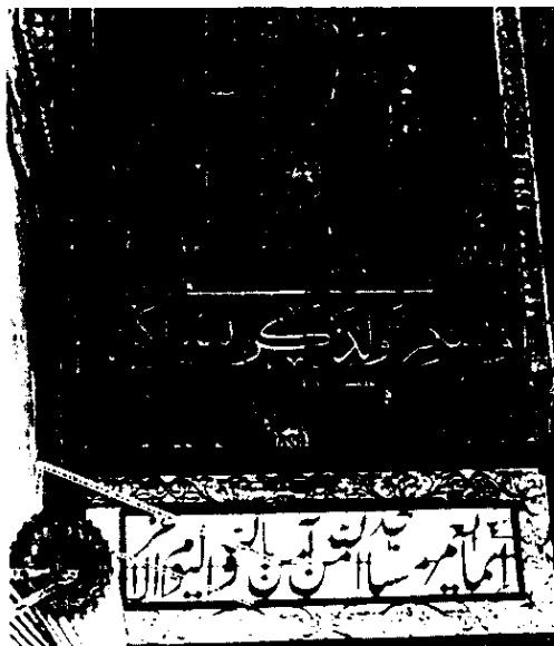
تزیینات ساده سردر ورودی مسجد جامع

ورودی شرقی در بازار بین‌الحرمین از سردر نسبتاً بلند با تزیینات مقرنس کاشی‌کاری بهره می‌برد که در گذر روزگار رنگ باخته است. ورودی غربی از بازار بزرگ با سردر مقرنس گچ‌کاری است و جلوخان آن در اشغال حجره‌های زیورآلات نقره است.