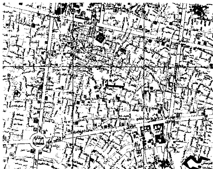
محدوده بازار در بافت شهری

مجموعه بازار و بناهای وابسته آن که همچنان مهم‌ترین مرکز تجاری کشور به شمار می‌رود، به مرور زمان ساخته شده است و از قدیمی‌ترین آن‌ها می‌توان از چهار سوی بزرگ و کوچک، تیمچه مهدیه و سرای امیر نام برد. مقارن با ساخت بناهای تجاری، مکان‌های دیگری نیز مثل مساجد، مدارس، حمام‌ها