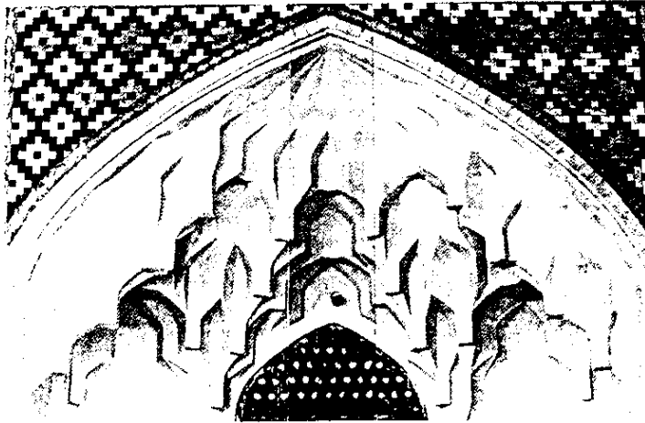
تزیینات مقرنس و کاشی‌کاری طاقنمای مسجد مدرسه شیخ عبدالحسین

مساجد در گذر روزگار شاهد فراز و نشیب‌های زیادی بوده و از جمله در فعالیت‌های سیاسی مثل انتخابات و شوراها نیز نقش حساسی ایفا نموده‌اند. میان شمار زیاد مساجد بازار، مساجد امام، جامع، حاج سیدعزیزالله و شیخ عبدالحسین و چند مسجد دیگر از اهمیت سیاسی بیشتر برخوردار هستند.