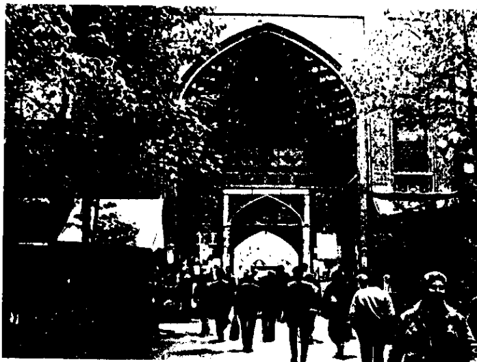
ورودی با شکوه شمالی مسجد امام

در معماری سنتی و مذهبی ما رمز هر بنایی در ورود به آن است و معمار هم با شگردهایی بر جذابیت آن می افزاید. شگفتا که بنای مسجد جامع پرده پوشی ندارد. سر در ساده آن جای تأملی برای ایستادن و سر به آسمان بردن نمی گذارد و از میان در، صحن آن بی هیچ ابهامی خود را می نمایاند. پرده‌های افتاده نیست، رمز و رازی نیست که انسان را به دنبال خود به گوشه‌ها بکشد تا شوق ماندن را بیدار کند.